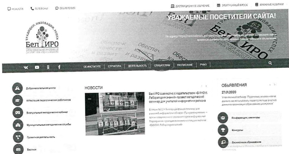
Рис.1 Раздел «Слушателям»