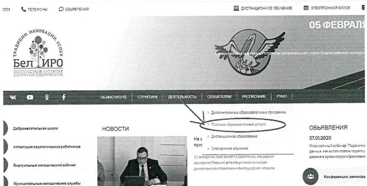
Рис.2 Раздел «Платные образовательные услуги»